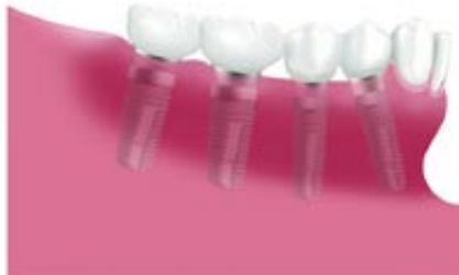
Négy szőlő korona négy implantátumon

Ha az oldalsó fogak mind hiányoznak és mégis rögzített fogpótlást szeretne, akkor az egyetlen jó megoldás a beültetés. Implantátum nélkül csak kivethető részleges fogsor készíthető annak minden ismert hátrányával, pl. hogy mechanikus tartóelemeket, kapcsokat kell alkalmazni, melyek az esztétika és a viselési komfort szempontjából sem ideálisak.