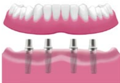
A protézis rögzítése teleszkóp koronákkal