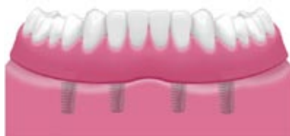
Implantátumon rögzített kivethető protézis