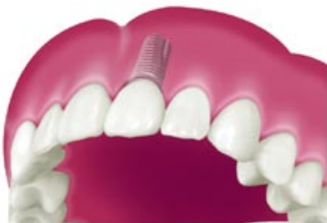
Implantátumon rögzülő korona