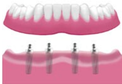
Gömbfejes műcsonkkal rögzülő protézis