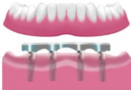
Stéggel rögzülő protézis