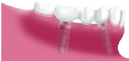
Háromtagú híd két implantátumon