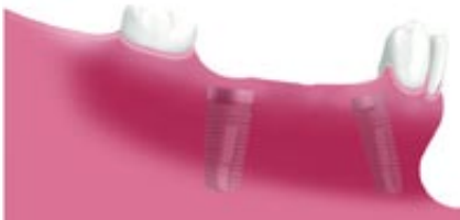
Két becsontosodott implantátum