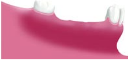
Sorközi foghiány több fog elvesztése után